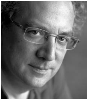
Uri Caine piano