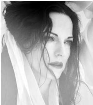
Maya Beiser cello