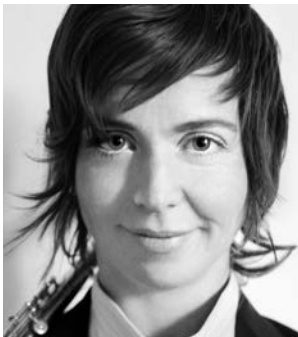
Claire Chase flute