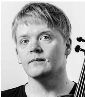
Pekka Kuusisto violin