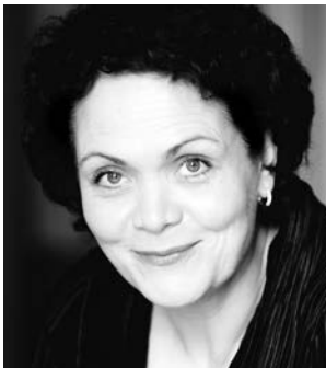
Tabea Zimmermann viola