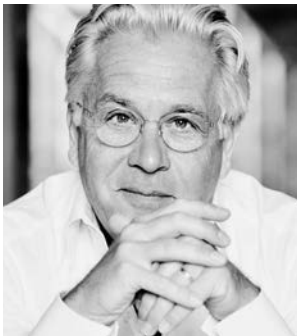
Håkan Hardenberger trumpet