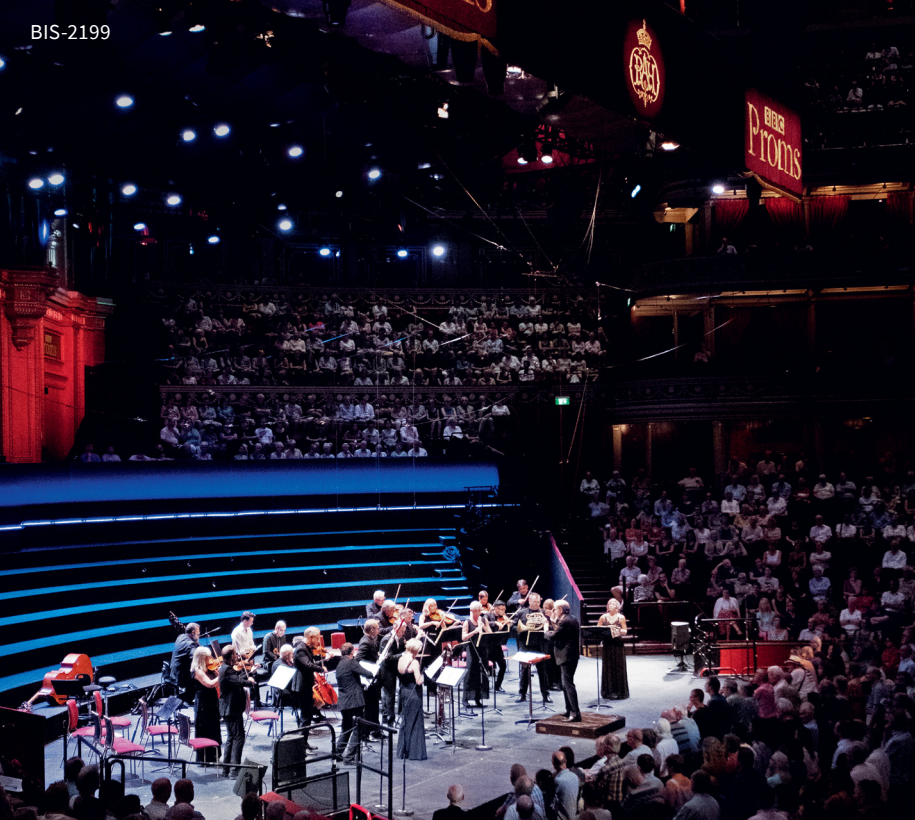
The Swedish Chamber Orchestra and Thomas Dausgaard performing Brandenburg Concerto No. 1 at the BBC Proms in Albert Hall on 5th August 2018