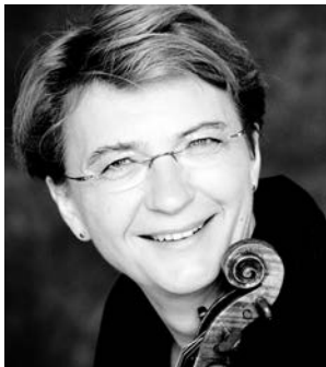
Antje Weithaas violin